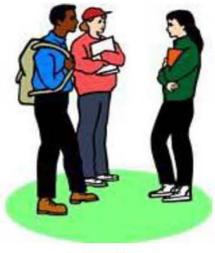
Calon Peserta SBMPTBR Th. 2017

Membayar biaya pendaftaran SBMPTBR Tahun 2017 sebesar Rp. 300.000,- untuk Kelompok Ujian SAINTEK atau Kelompok Ujian SOSHUM dengan menggunakan nomor identitas berupa NIK (Nomor Induk Kependudukan)